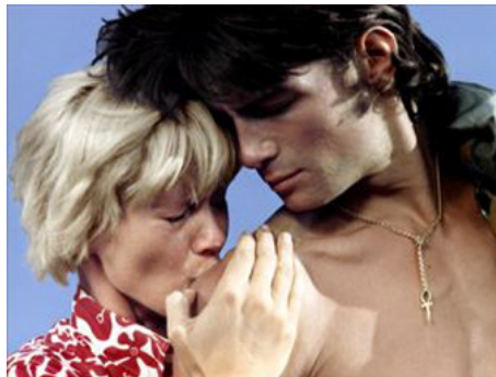
1970 LA ROUTE DE SALINA (Road to Salina) de Claude Chabrol avec Mimsy Farmer