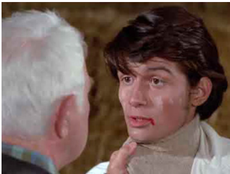
1970 LA HORSE de Pierre Granier-Deferre avec Jean Gabin