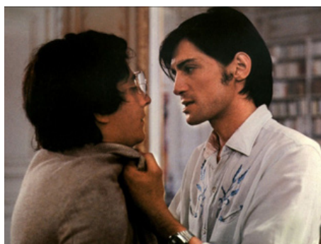
1980 JE VAIS CRAQUER de François Leterrier avec Christian Clavier