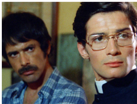
1972 LA LONGUE NUIT DE L'EXORCISME (Non si sevizia un paperino) de Lucio Fulci avec Tomas Milian