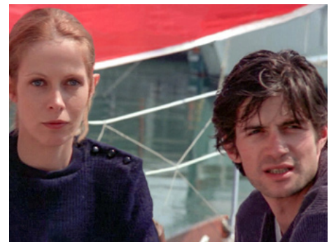
1978 CARESSES BOURGEOISES (Una spirala di nebbia) d'Eriprando Visconti avec Claude Jade