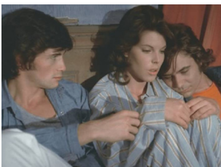
1973 UN OFFICIER DE POLICE SANS IMPORTANCE de Jean Larriaga avec Dani, Julien Negulesco