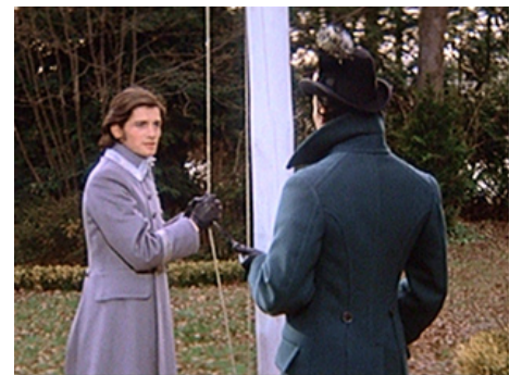
1972 LUDWIG OU LE CRÉPUSCULE DES DIEUX (Ludwig) de Luchino Visconti