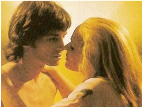
1975 URSULA L'ANTI-GANG (Colpo in canna) de Fernando Di Leo avec Ursula Andress