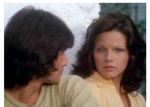
1974 UN PARFUM D'AMOUR (Virilità) de Paolo Cavara avec Agostina Belli