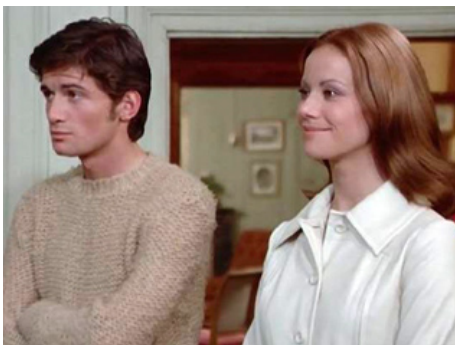
1971 UN PEU DE SOLEIL DANS L'EAU FROIDE de Jacques Deray avec Claudine Auger