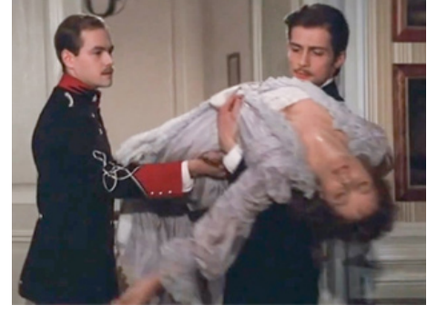
1976 L'INNOCENT (L'Innocente) de Luchino Visconti avec Didier Haudepin, Laura Antonelli