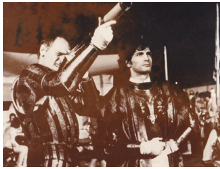
1975 LA GRANDE BAGARRE (Il soldato di ventura) de Pasquale Festa Campanile