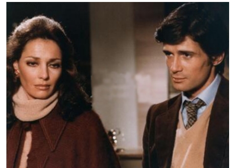
1977 L'EMMURÉE VIVANTE (Sette note in nero) de Lucio Fulci avec Jennifer O'Neill