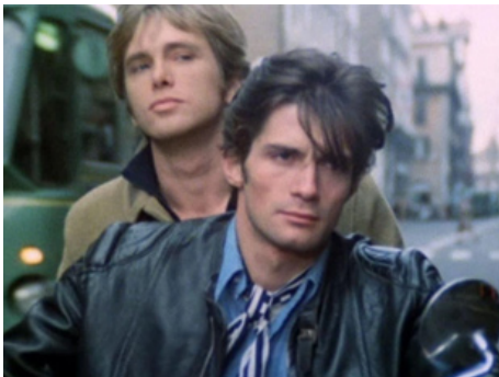
1976 VIVEZ COMME UN FLIC, MOURREZ COMME UN HOMME de Ruggero Deodato avec Ray Lovelock