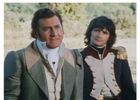
1981 LE MARQUIS S'AMUSE (Il Marchese del Grillo) de Mario Monicelli avec Albert Sordi