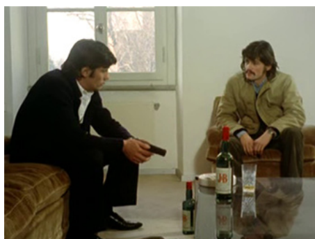
1973 LES GRANDS FUSILS (Tony Arzenta) de Duccio Tessari avec Alain Delon