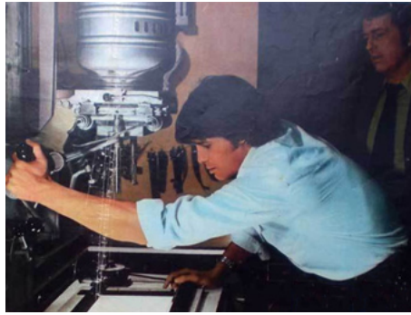
1976 LE MARSEILLAIS (Il Marsigliese) de Giacomo Battiato