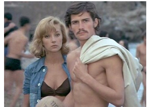
1971 LES AVEUX LES PLUS DOUX d'Édouard Molinaro avec Caroline Cellier