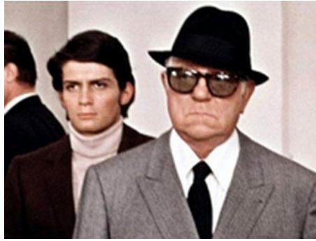
1969 LE CLAN DES SICILIENS d'Henri Verneuil avec Jean Gabin